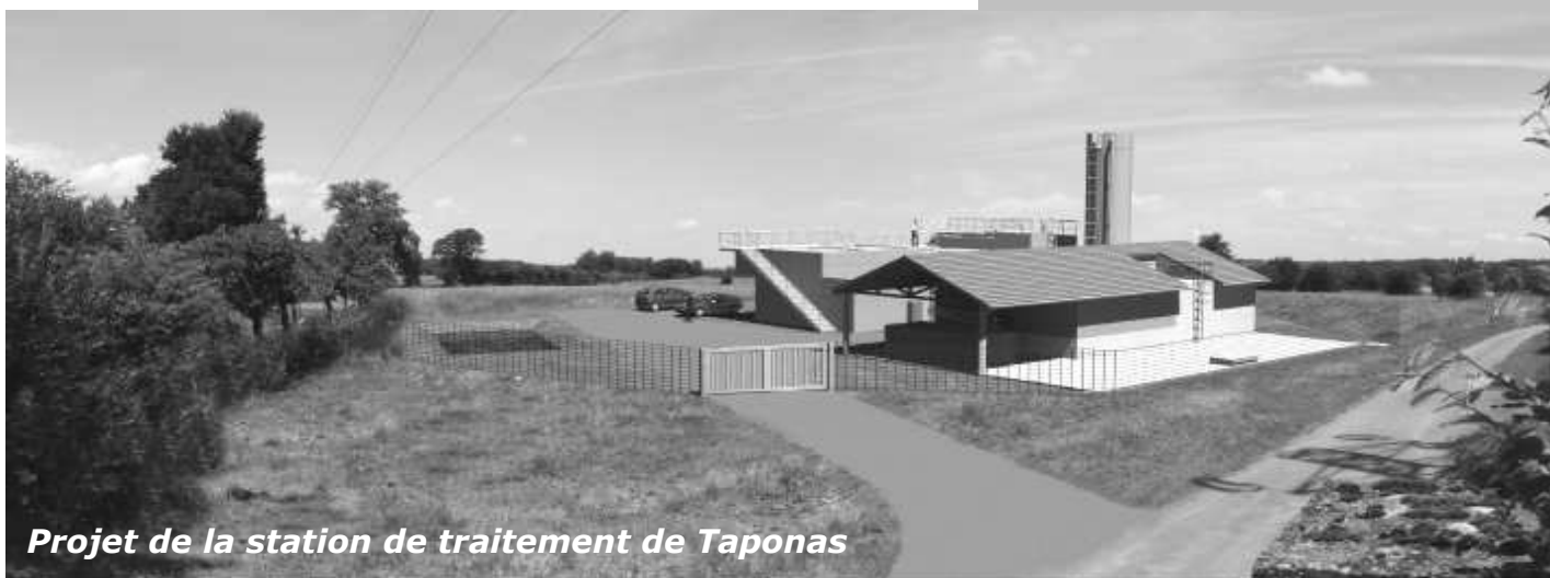
Projet de la station de traitement de Taponas

Pour votre confort et la qualité de votre eau, une nouvelle station de traitement va voir le jour d'ici 2015.