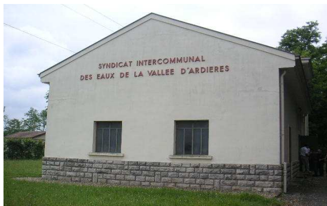
Station de pompage de Taponas

Le SIEVA est un établissement public de coopération intercommunal dont la mission est de produire et distribuer, aux abonnés du service, une eau potable conformément à la réglementation en quantité et qualité suffisante.